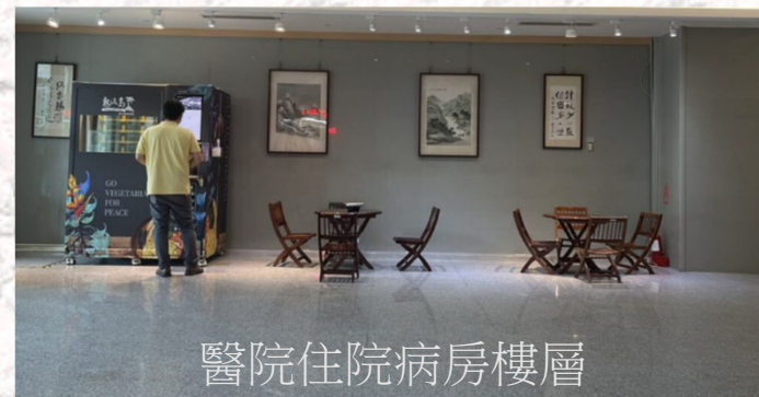
醫院住院病房樓層